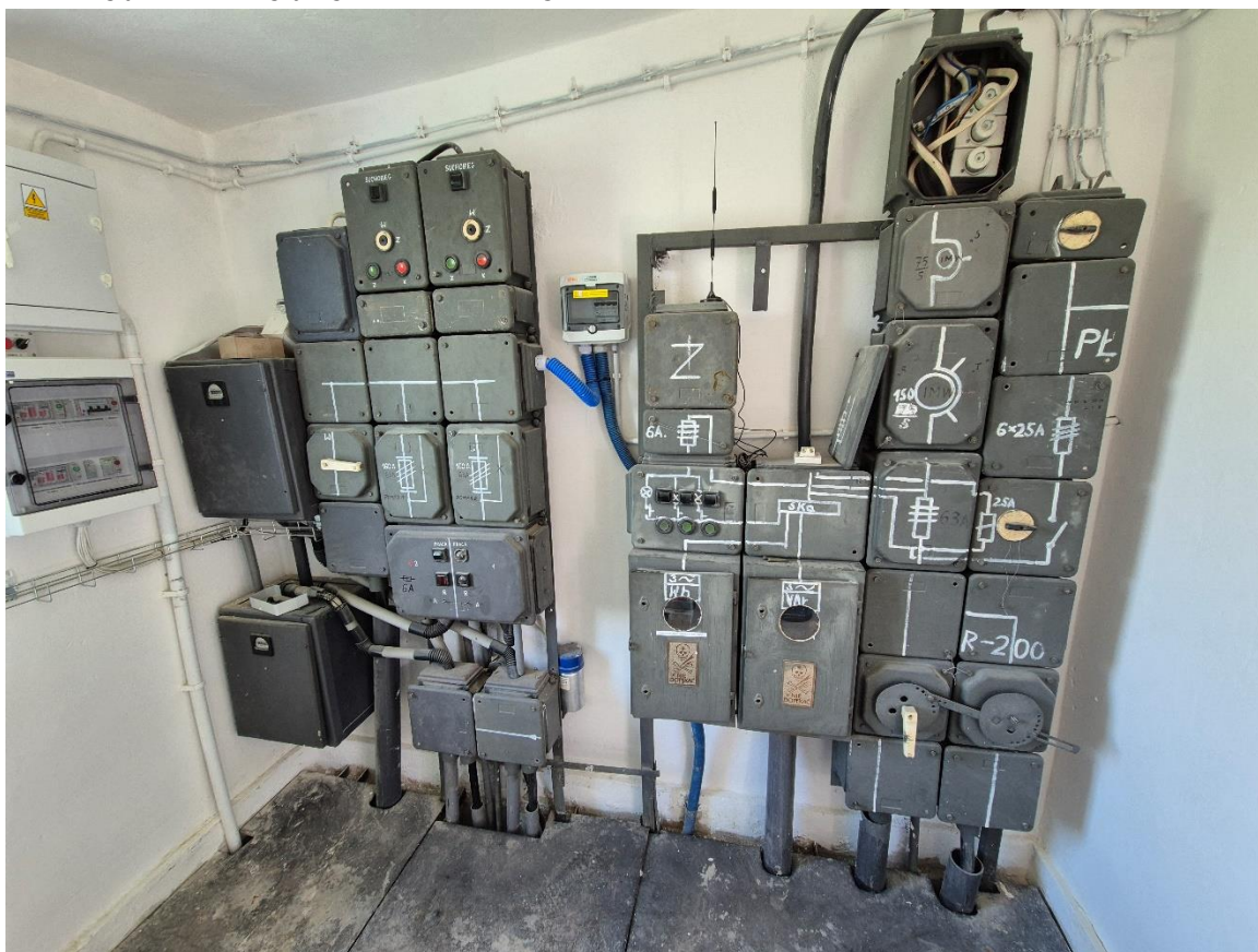
Zdjęcie 1 – lokalizacja istniejących urządzeń w pomieszczeniu ujęcia