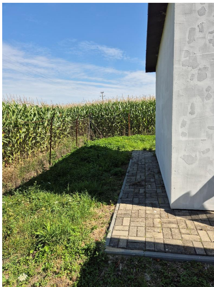
Zdjęcie 2 – planowana lokalizacja agregatu